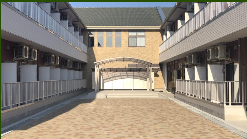
中庭 様々なイベントを行うことができます。