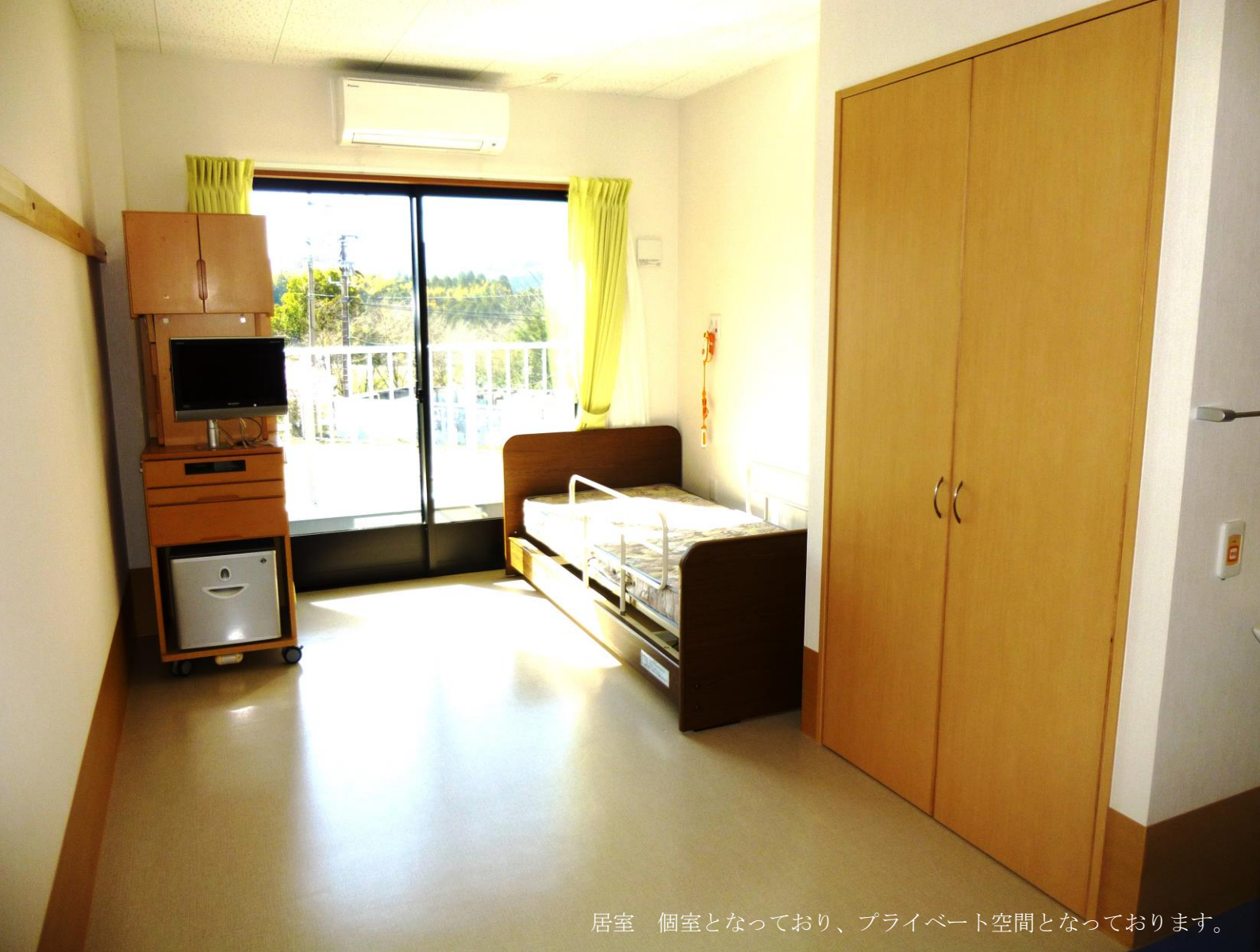
居室 個室となっており、プライベート空間となっております。