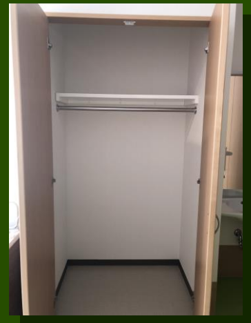
居室内は収納スペースを多く取っており自宅から荷物をお持ちになっても大丈夫です。