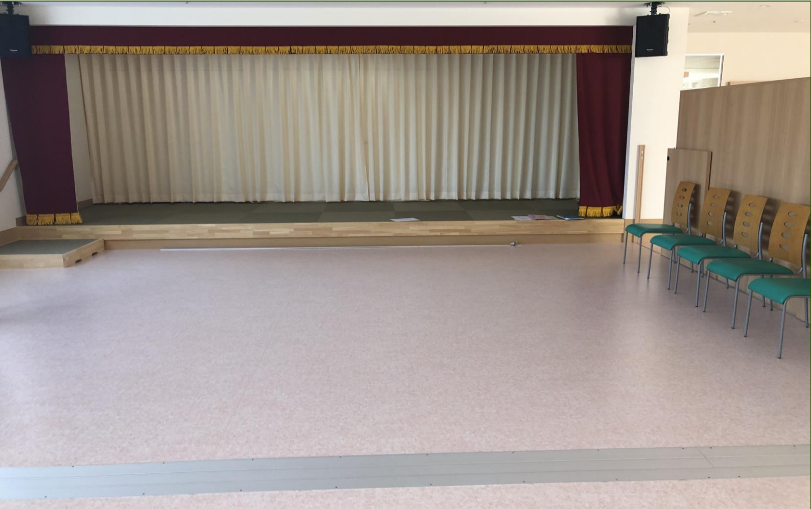
食堂 前方にステージがあり、様々なイベントを行います。