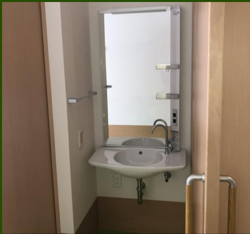
洗面所を居室内に設置しております。居室内で身支度を整えることができます。