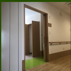
居室の入口は段差のないバリアフリー仕様で開閉がスムーズなスライドドアを採用しています。